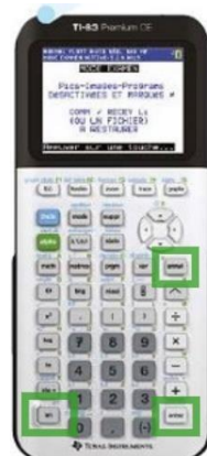
TI 83 CE