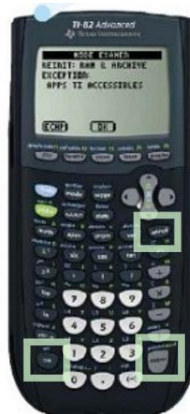
TI 82 Advanced